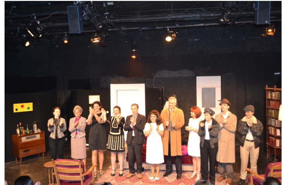
Los Palomos - Junio 2016 - Theater Brett

Mehr Information unter: www.solesdelsur.com