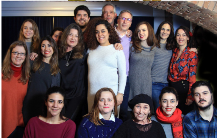
VIENA, DICIEMBRE 2018: SOLES DEL SUR CON LA ACTRIZ VERÓNICA FORQUÉ EN SU TALLER INTENSIVO DE INTERPRETACIÓN.